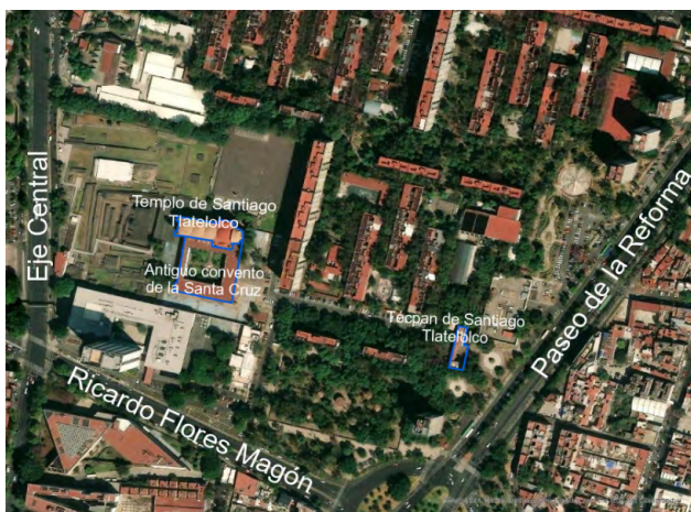
Figura 3. Ubicación de zonas patrimoniales.

Su historia comienza al ser el primer colegio de América destinada a la enseñanza de la población indígena y su auge acompañado de las enseñanzas y las artes fue durante el siglo XVI, pero su unión solo permaneció por 50 años ya que posterior a ello se separó como parroquia (Gobierno de la Ciudad de México, s.f., c).