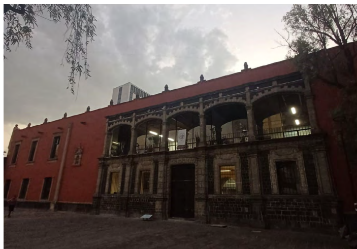
Figura 6. Fachada del convento de la Santa Cruz.

Actualmente el Colegio de la Santa Cruz es parte de la Secretaría de Relaciones Exteriores y en su segundo nivel alberga la Biblioteca José María Lafragua, el acceso es gratuito y se puede visitar tanto el interior del colegio como el segundo piso (Figura 6).