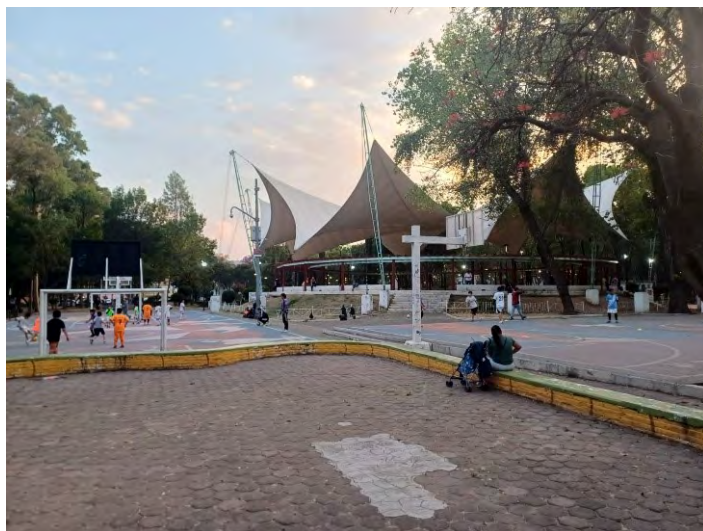
Figura 10. Ágora de Tlatelolco, segunda sección. Fuente: Sarai Lizu Jiménez Fernández, marzo, 2025.

para jóvenes y adultos incluso de colonias aledañas. Existen durante el día actividades como partidos de fútbol, basquetbol, entrenamiento infantil en patinaje; más al fondo existe un parque para perros, donde personas de todas las edades pasean a sus mascotas y pasan a los juegos infantiles que están alrededor del Ágora (Figura 10).