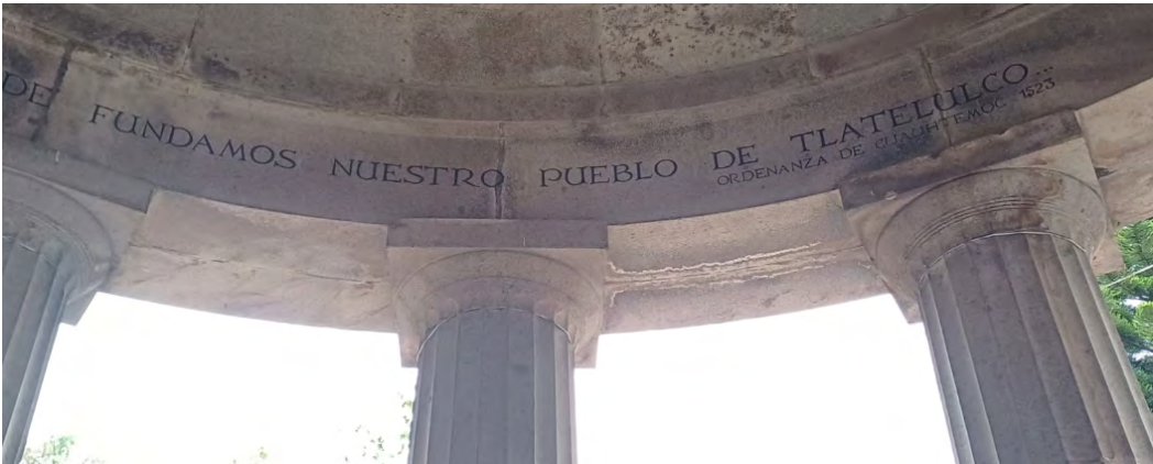
Figura 1. Templo monóptero con el mandato de Cuauhtémoc en su domo.

En algunos escritos viejos el nombre de Tlatelolco se ve escrito como Tlatelulco, como se puede ver en el templo Monóptero ubicado en el jardín de Santiago. Donde se puede leer la frase con la que Cuauhtémoc describía Tlatelolcu “Aquí ponemos y asentamos en la forma en la que hallamos la laguna grande, como atijereada: sus olas como plata y brillantes como el oro, tan fragante y olorosa, donde fundamos nuestro pueblo de Tlatelulco. Ordenanza de Cuauhtémoc 1523” (Figura 1).