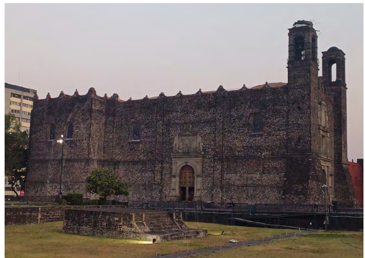
Figura 4. Templo de Santiago Tlatelolco. Fuente: Sarai Lizu Jiménez Fernández, marzo, 2025.

Fue hasta 1962 con el desarrollo de la Unidad Habitacional Adolfo López Mateos Nonoalco Tlatelolco, que fue restaurada y modificada para que la población pudiera gozar de las actividades religiosas que pudo ofrecer, cuando abrió sus puertas en 1964 (Gobierno de la Ciudad de México, s.f., c) (Figura 4).