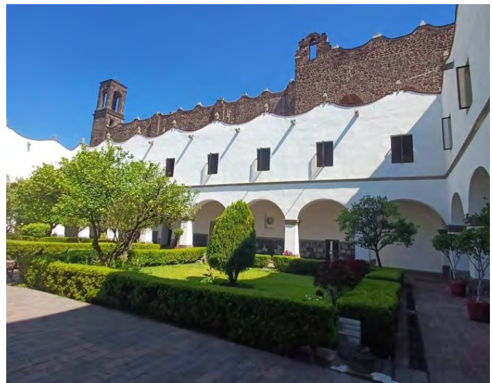
Figura 5. Interior del colegio de la Santa Cruz.