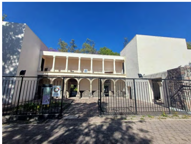
Figura 7. Técpán Santiago Tlatelolco. Fecha: Sarai Lizu Jiménez Fernández, marzo, 2025.

Fue en el año de 1850 que el gobierno de la ciudad optó por convertirlo en la correccional de San Antonio, donde se daban talleres y oficios que aprender a los jóvenes que entraban al sitio, estuvo en actividades durante un siglo (Gobierno de la Ciudad de México, s.f., d). En su interior alberga la que se dice fue la primera obra de David Alfaro Siqueiros.