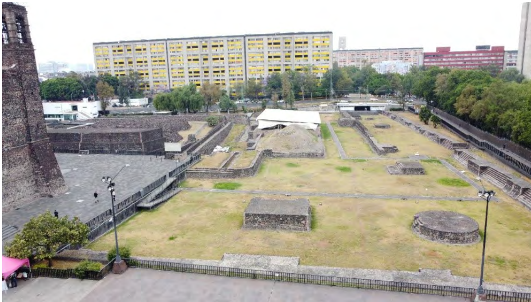
Figura 8. Zona Arqueológica de Tlatelolco.

nombrado por Patrimonio Intangible con el número de oficio SC/DDC/CP/0994-18 por la Secretaría de Cultura de la Ciudad de México (Secretaría de Cultura de la Ciudad de México, 2018) (Figura 8).