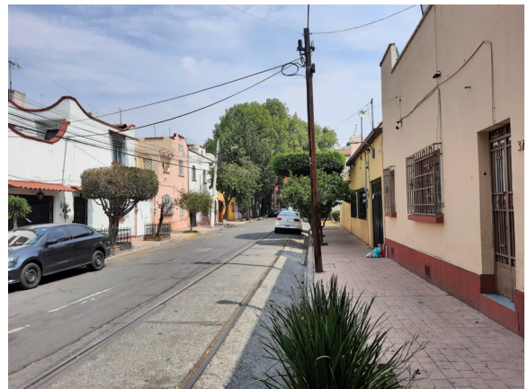
Figura 6. El valor arquitectónico contextual, acompañado por la infraestructura hasta la primera mitad del siglo XX.