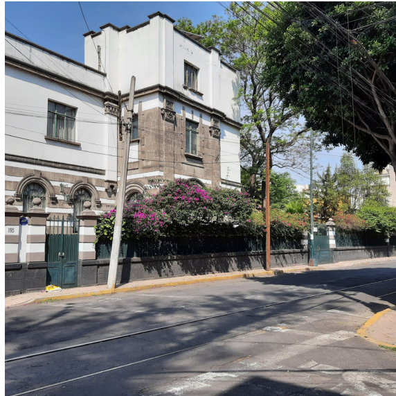
Figura 9. Arquitectura o hito mayor del barrio.