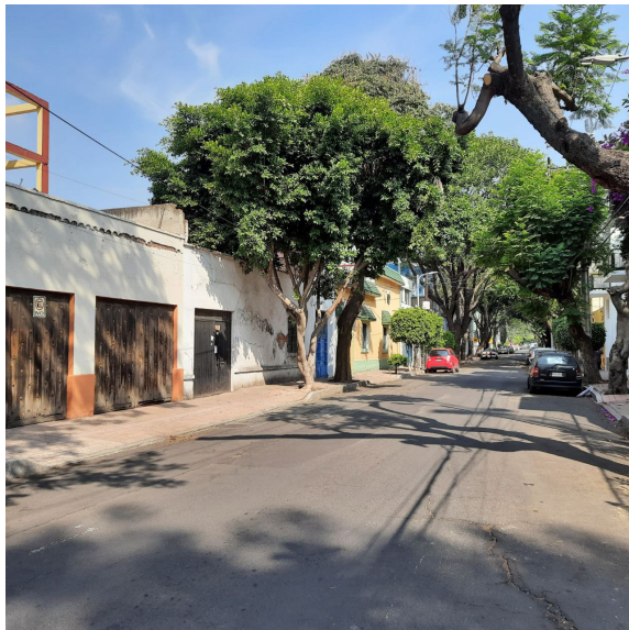
Figura 8. La flora local preexiste para dignificar el tejido urbano local, y atenúa la arquitectura contemporánea que se integra al lugar.