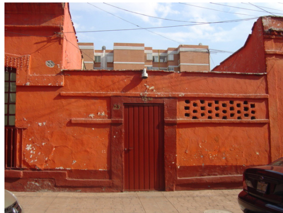
Figura 10. Arquitectura menor de valor contextual.