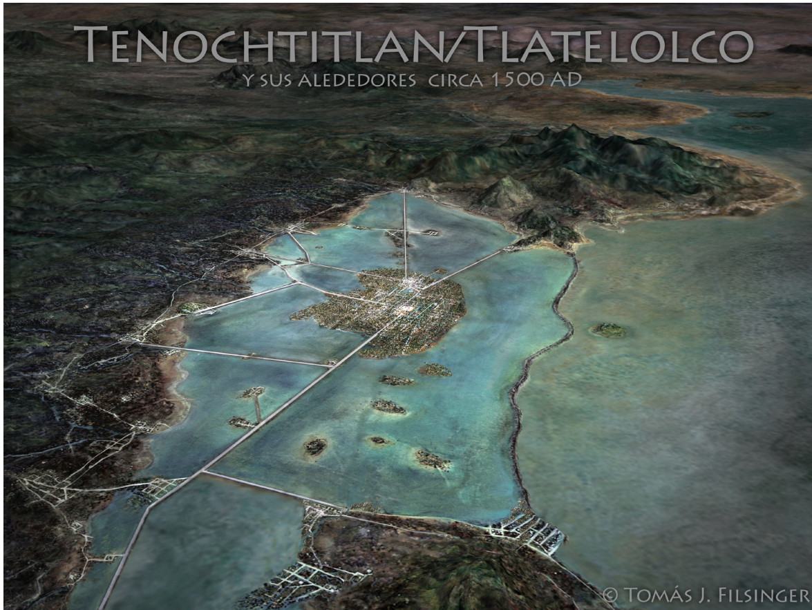
Figura 3. Paisaje del entorno natural de la ciudad de México Tenochtitlán.

una gran contaminación atmosférica que oculta las sierras.