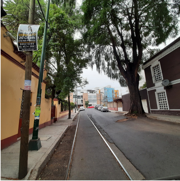
Figura 7. El valor contextual histórico mostrado por la vegetación y las huellas del antiguo tranvía, parte de la vida cotidiana de otros tiempos.

El eje está ubicado en la demarcación de la Alcaldía Miguel Hidalgo, y se extiende sobre las colonias Tacuba y Nextitla. Está conformado por un conjunto de inmuebles catalogados por considerar que cuentan con un valor histórico, artístico y/o patrimonial según SEDUVI, y los cuales también evalúan organismos como el INAH o el INBA (Figuras 5 y 6).